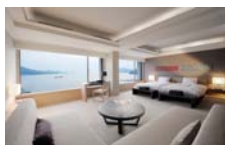
オーシャンビュー・スイート

1室2名様ご利用/1泊朝食付・お一人様 ハーバービュー・ツイン …… 7,350円 オーシャンビュー・スイート …… 12,600円 ※お一人様でのご利用は、6,300円UPとなります。